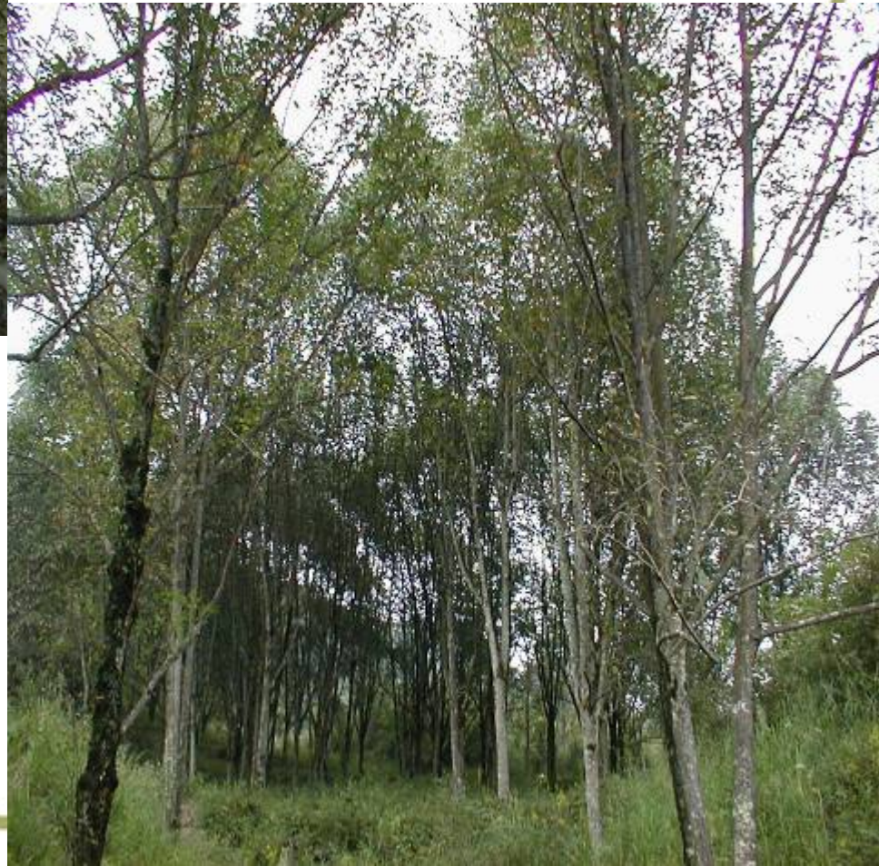
Magnolia biondii Pamp.