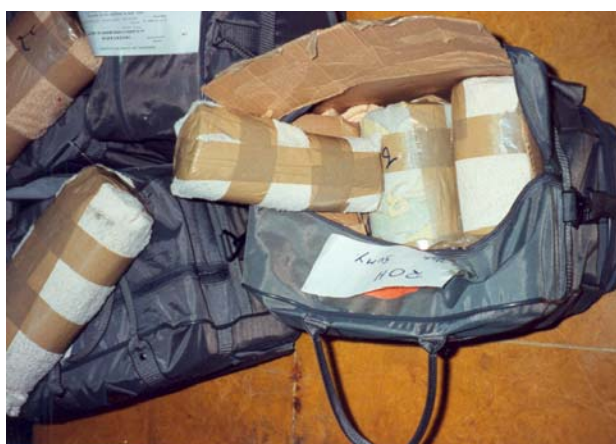
149 kilos d'ivoire semi-travaillé en provenance du Gabon et à destination de la Corée du Sud, saisis le 5 juin 1991 à l'aéroport de Bruxelles-National

Il semblerait qu'un nombre important de saisies belges d'envois en transit concerne de l'ivoire brut ou semi-travaillé africain envoyé vers les manufactures d'ivoire asiatiques via la Belgique. Cet ivoire illégal transiterait par la Belgique en raison de voies aériennes privilégiées reliant ce pays aux pays africains producteurs d'ivoire d'une part et aux marchés asiatiques d'autre part. Les pays asiatiques constitueraient alors soit des pays où l'ivoire est travaillé, soit des pays de destination finale. L'ivoire saisi en transit en Belgique en provenance du Gabon était, par exemple, dans presque tous les cas de saisie, destiné à la Corée du sud et, de même, l'ivoire saisi en Belgique en provenance du Mali était presque toujours destiné à la Chine. Les données ETIS-Out rendent compte également d'une importante saisie d'ivoire, 350 kg, effectuée en Corée du Sud en 1997, concernant un envoi provenant du Gabon ayant transité par la Belgique où il n'a pas par ailleurs été détecté ( Annexe 8 ). Les données ETIS-In attestent d'un même parcours pour de l'ivoire saisi en Belgique provenant du Gabon et destiné à la Corée du Sud en 1989, 1991 et 1997 alors que les données EU-TWIX rendent compte d'un itinéraire similaire pour de l'ivoire saisi en 1989 et 1991, mais pas en 1997.